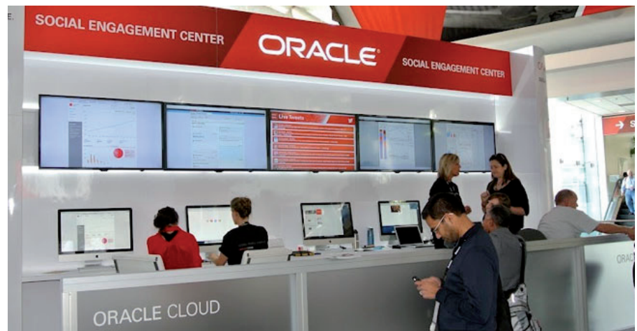
מרכז ההיקשרות החברתית Social Engagement בכנס עצמו. נאה דורש נאה מקיים בענן של אורקל