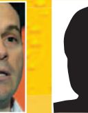
מחלקות מחקר ואירגונים