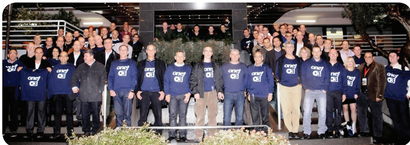
חברי פורום C3 מתייצבים לצילום הקבוצתי המסורתי, לבושי חולצות עליהן מתנוסס הלוגו של One1 - אחת מספקיות ה-IT שפרסו חסותן על האירוע ברומא