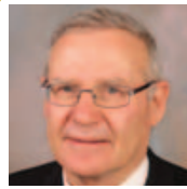
אלון (מיל) עמוס ידלין ראש המכון למחקרי ביטחון לאומי