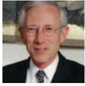
פרופ' שמעון פישר נגיד בנק ישראל