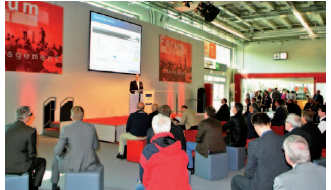
הכנסים נערכו בביתן התצוגות עצמו. מימין, ביתן אדום להרצאות על ניהול אבטחה. משמאל, המסלול הכחול על טכנולוגיית האבטחה. בגרמניה כולם מדברים בשקט (כלומר לא צורחים). לכן אפשר לשוחח בביתן וגם להקשיב להרצאות. יש מה ללמוד...