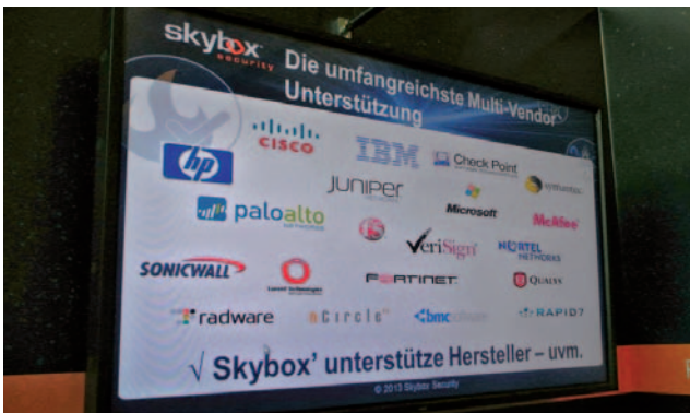
שקף של כל השותפים הטכנולוגיים שסקייבוקס מנהלת את תוכנות האבטחה שלהם