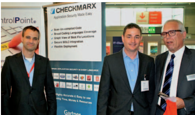
הנה צור בביתנה של Checkmarx, שנרשמה לתצוגה ברבע האחרון ואכן הופיעה בדף העדכון של הקטלוג המודפס (כן, עדיין מדפיסים קטלוג). ויש גם אלקטרוני, כמובן