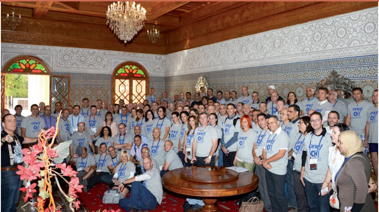
בתום שני ימי הדיונים שהתקיימו במרקש, התקבצו כל משתתפי הכנס לצילום קבוצתי, כמיטב המסורת.

טובים יותר. ל-Information Builder יש את כלי ה-BI והאנליטיקה שיודעים לנהל את כל הרכיבים האלו. הם מביאים בסופו של דבר ROI גבוה יותר", סיכם בוקילי.