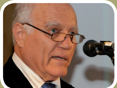
100 אחוז מתודולוגיה. אשר יובל מספר על 30 שנות חברת מתודה וזיכרונות שהחלו לפני 70 שנה. יום הולדת כפול (עמ' 46)