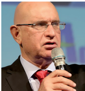
ח"כ פרופ' אבישי ברוורמן

"יש בישראל פרדוקס אדיר", אמר. מצד אחד יש פה אנשים מוכשרים, ישראל מוצלחת מבחינות רבות, אחוז הצמיחה גבוה יותר מרוב אירופה, שיעור